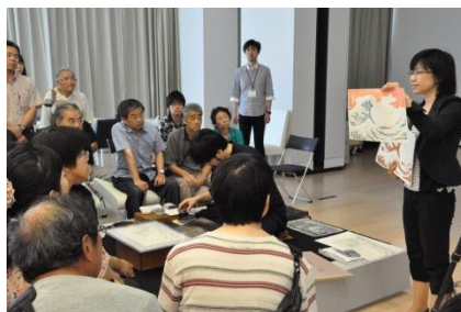
Зураг 2 Үзүүлбэрийн явц болон үкиё-э зургийн талаар тайлбарлаж буй нь