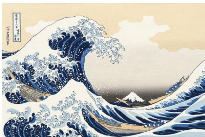
Зураг 1 Бодитоор хэвлэж үзүүлэх үкиё-э зураг “Канавагийн агуу давалгаа”