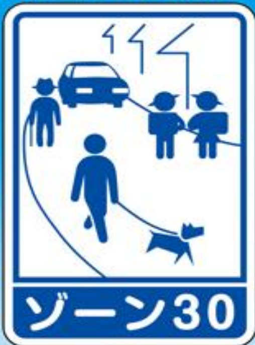
「ゾーン30」シンボルマーク画像